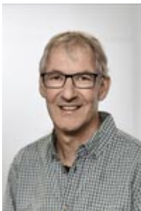
Stefan Zwygart Redaktion Newsletter, Aus- und Weiterbildung Kontakt