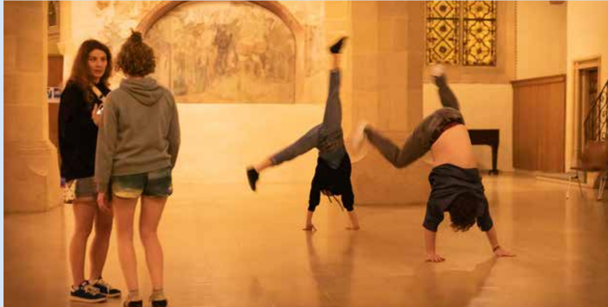
Nuit des églises à Buswil.

lorsqu'elles veulent un soutien en matière de coopération.