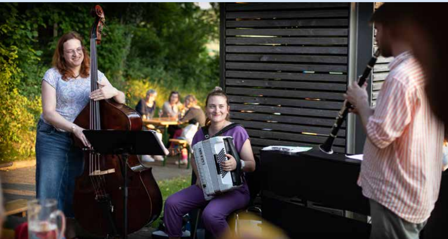
Nuit des églises à Busswil.