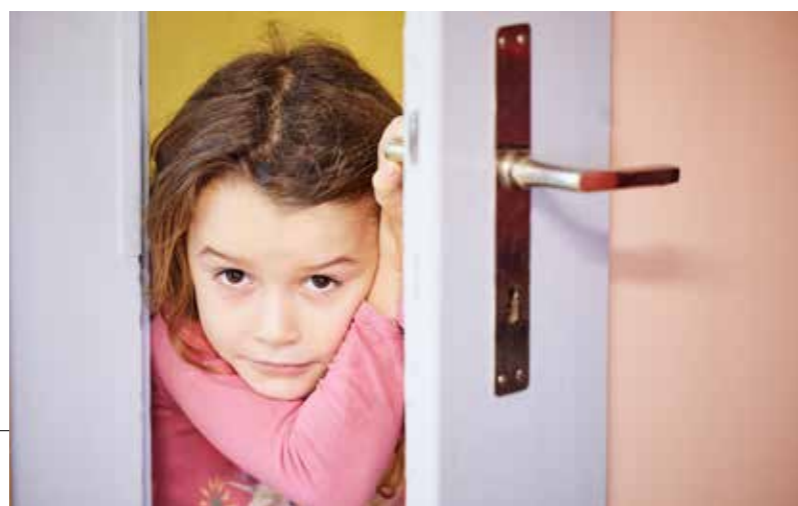
Communication et présence numériques Image de la page d'accueil du site cate.ch .