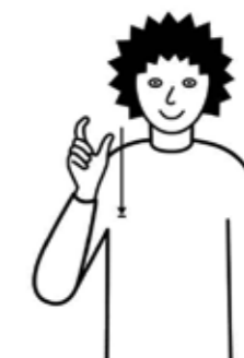
Une personne, quelqu'un