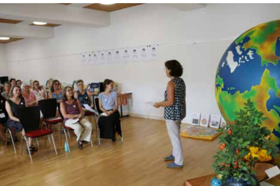
Journée des médias avec ballon Togu représentant le globe terrestre.

Durant l'année scolaire 2022-2023, 335 élèves bénéficiant d'un encadrement spécifique ont été catéchisés dans des groupes spécialisés ou en intégration (35), dont 244 dans le canton de Berne et 91 dans le canton de Soleure. Les Églises réformées Berne-Jura-Soleure subventionnent les organes responsables de la catéchèse et de l'enseignement religieux spécialisés ainsi que des groupes réguliers à hauteur de 305 455,40 francs.