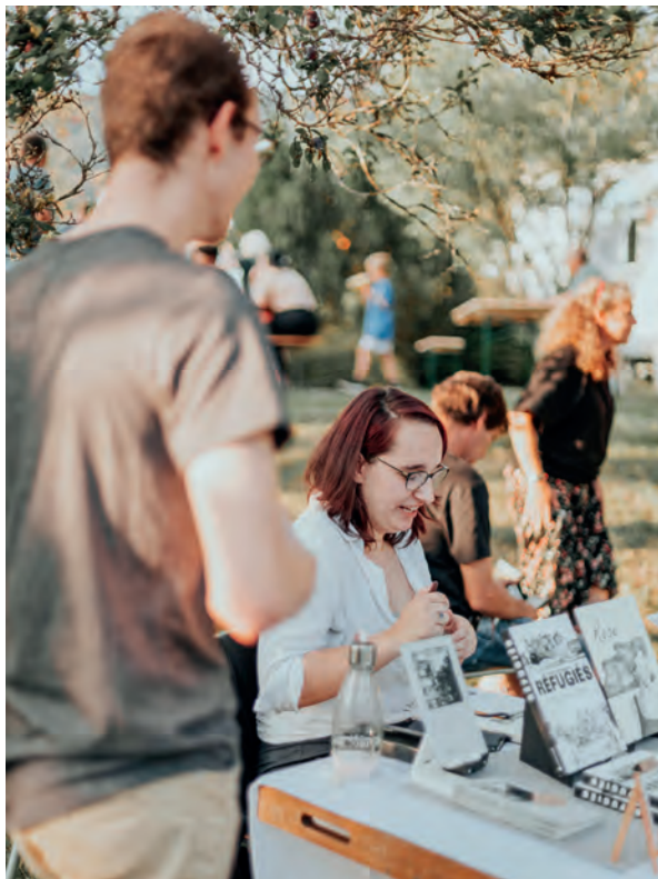
Le nouveau Festival «Jardins d'été» à Reconviiler est un des projets soutenus par le fonds d'expérimentation.