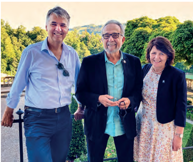
Pedro Arrojo-Aguda, rapporteur spécial des Nations Unies pour le droit à l'eau et à l'assainissement, était l'un des hôtes internationaux du réseau Blue Community.

L'année a été riche en événements, beaucoup de paroisses se sont mobilisées autour des différentes campagnes proposées par les œuvres d'entraide. Ainsi, beaucoup de soupes de carême ont pu être dégustées aux quatre coins de notre arrondissement, les roses elles aussi ont connu un beau succès. Cette année encore, nos cyclistes solidaires ont sillonné notre région et récolté des fonds pour des projets d'entraide. L'actualité internationale, notamment en Ukraine et en Afrique de l'Est a beaucoup mobilisé les œuvres d'entraide. Grâce au soutien des paroisses, beaucoup de personnes ont pu recevoir de l'aide d'urgence. Si nos objectifs financiers sont loin d'avoir été atteints, les événements se sont multipliés: fondue, jass, cultes, soirée de formation, vente de savons... autant d'occasions de faire connaître et de faire vivre l'action solidaire de notre Eglise. ■