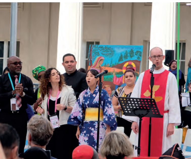
L'Assemblée du COE a marqué durablement l'assistance.