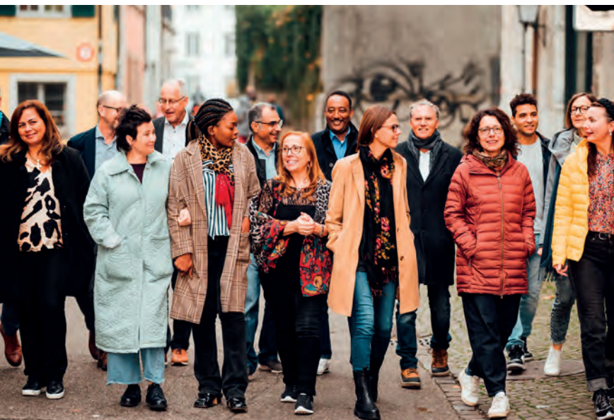
Le Festival BREF à Neuchâtel a offert des opportunités d'échanges.

le Service migration a animé l'atelier «Bibliothèque vivante». Une synergie avec la paroisse de Delémont et Eglise en route a aussi donné naissance à un cinéma open air avec des personnes autochtones et des familles migrantes. ■