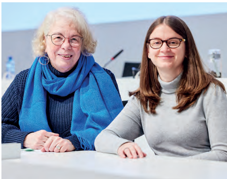
Deux femmes président le Synode pour la première fois de son histoire.