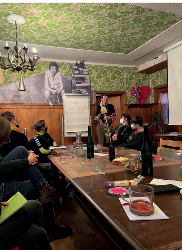
Impressions des journées du réseautage «Eglise qui bouge».

Le nouveau secteur d'activités spécialisé dans le développement participatif des paroisses a laissé ses premières empreintes cette année. Des conseils, des ateliers et des cours ont donné des impulsions sur la manière dont les paroisses peuvent initier des changements et envisager des développements. En règle générale, de tels processus s'engagent en collaboration directe avec les personnes sur place. Le développement participatif des paroisses commence par la recherche et l'identification des ressources à disposition et par la mise en relation de personnes partageant des préoccupations communes. Cela implique de franchir son propre seuil de compétence. De nombreuses paroisses ont