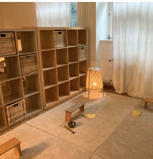
La «salle du silence» à l'Université invite à la méditation.

formats facilitent la participation aux cours de personnes originaires de différentes régions et ciblent manifestement des groupes sociaux plus larges.