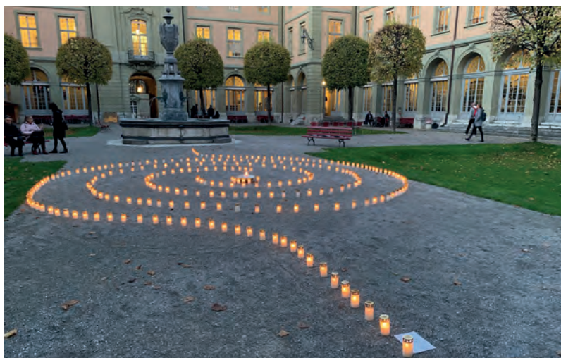
«Bärn treit», événement public sur la fin de vie organisé le 2 novembre.