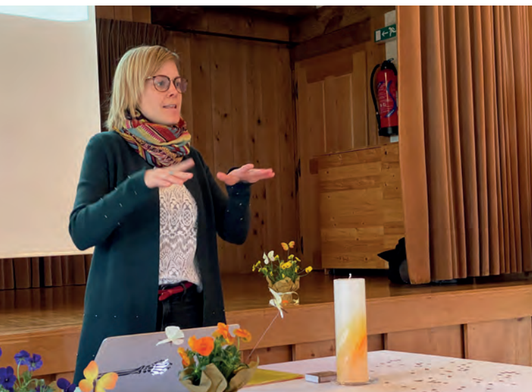
L'Eglise des signes se démène, aussi au parcours d'accrobranche de Berne.

La formation professionnelle socio-diaconale constitue un enjeu majeur, et le secteur subventionne les paroisses qui investissent dans ce domaine. Parmi les activités qui contribuent à la qualification de la diaconie, citons encore la reconnaissance de ministère et la révision de l'agrégation au ministère socio-diaconal. En fin de compte, ce sont les paroisses et leur personnel qui contribuent le plus largement au travail social d'intérêt général. ■