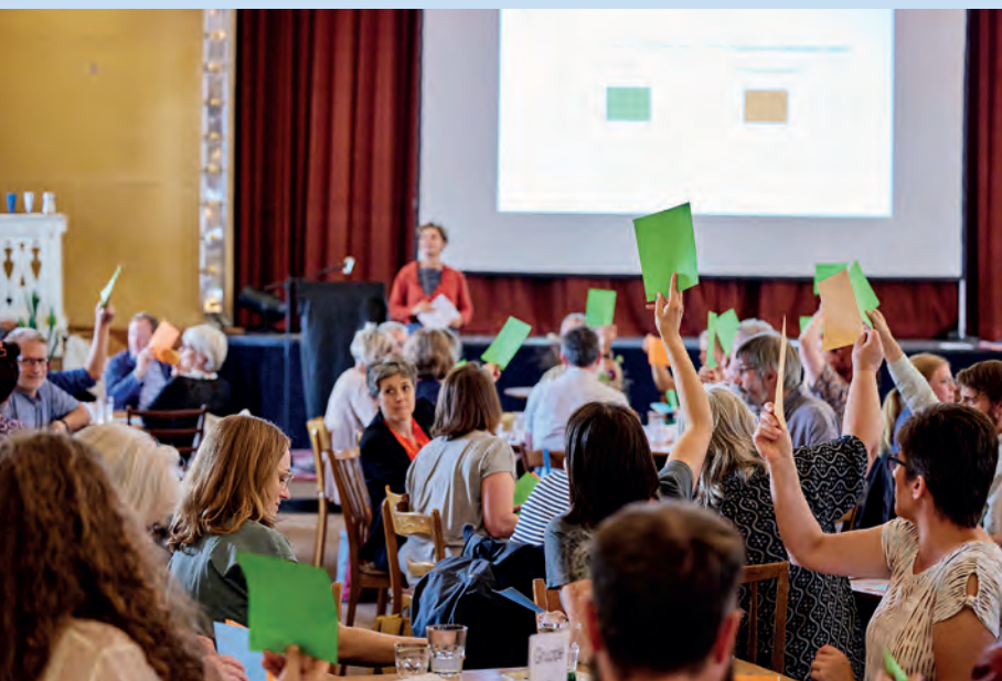
Une des conférences pastorales et des présidences s'est déroulée à la «Heitere Fahne» à Wabern devant une assistance nombreuse.

d'expériences pratiques et des clés du succès d'une direction de la paroisse placée sous le signe de la coopération entre son conseil et son ministère pastoral. Certaines difficultés, mais surtout de très nombreuses expériences encourageantes ont été évoquées au sein des groupes. Il est clairement ressorti de toutes les conférences que le modèle d'une direction commune de la paroisse est convaincant, mais qu'il doit être porté par une attitude empreinte de confiance réciproque. Ce n'est qu'en pratiquant l'écoute mutuelle et en étant persuadé de la bonne volonté de l'autre que le modèle peut réussir. Aucune réglementation juridique ne peut pallier le manque de confiance. ■