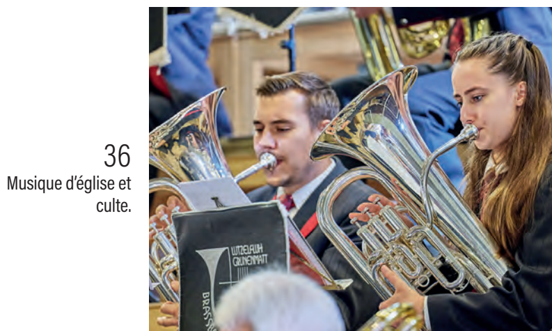
36 Musique d'église et culte.