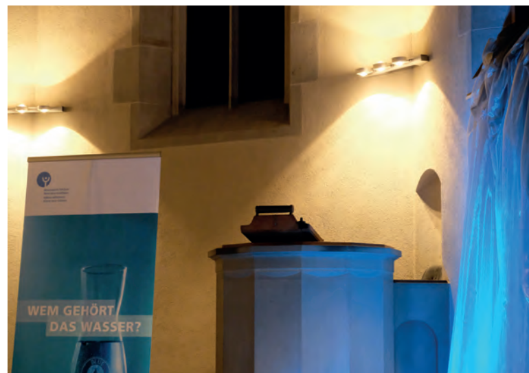
Ouverture de la Semaine mondiale de l'eau en mars à Zurich.