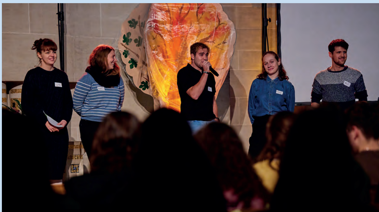
Jeunes adultes de différentes paroisses réunis pour le culte «reformé».