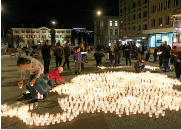
3 Action «Bougies pour la paix».