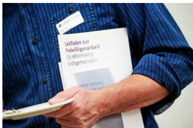
Les conférences des présidences ont débattu de thèmes importants.