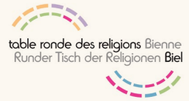
table ronde des religions Bienne Runder Tisch der Religionen Biel

WOCHE DER RELIGIONEN SEMAINE DES RELIGIONS SETTIMANA DELLE RELIGIONI