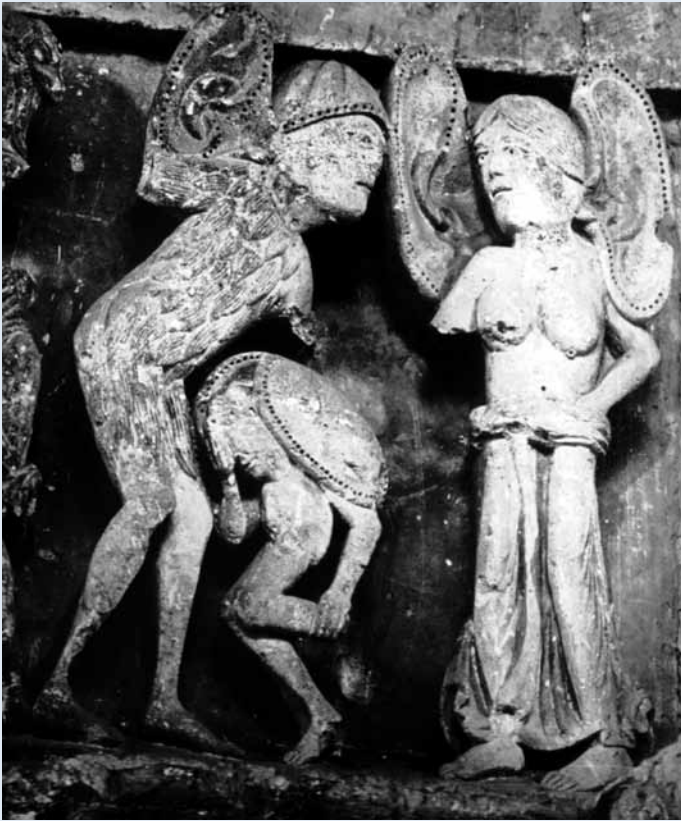
Zum Bild siehe Seite 8

meinschaft und begeht einen schweren Frevel, der die schärfsten Strafen nach sich zieht.