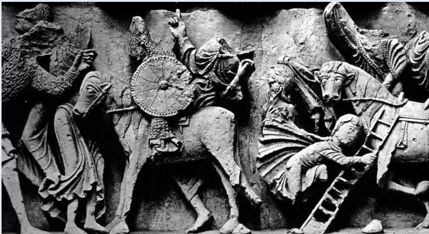
Zum Bild siehe Seite 8

schenfälle zwischen Schweizern und Italienern. Heute stammen viele Jugendliche im Treff aus dem Balkan, vorwiegend aus dem Kosovo. Es kommen auch andere Jugendliche, Probleme gibt es keine. Bei der Werbung für den Jugendtreff in den Konfirmationsklassen kommt aber häufig die Rückmeldung: «Da sind eh nur die Ausländer», wenn es nett tönt. Es ist harte Arbeit, die Schweizerinnen und Schweizer mit und ohne Migrationshintergrund gemeinsam zur Nutzung des Treffs zu motivieren. Das funktioniert besser, wenn es um ein bestimmtes Projekt geht.