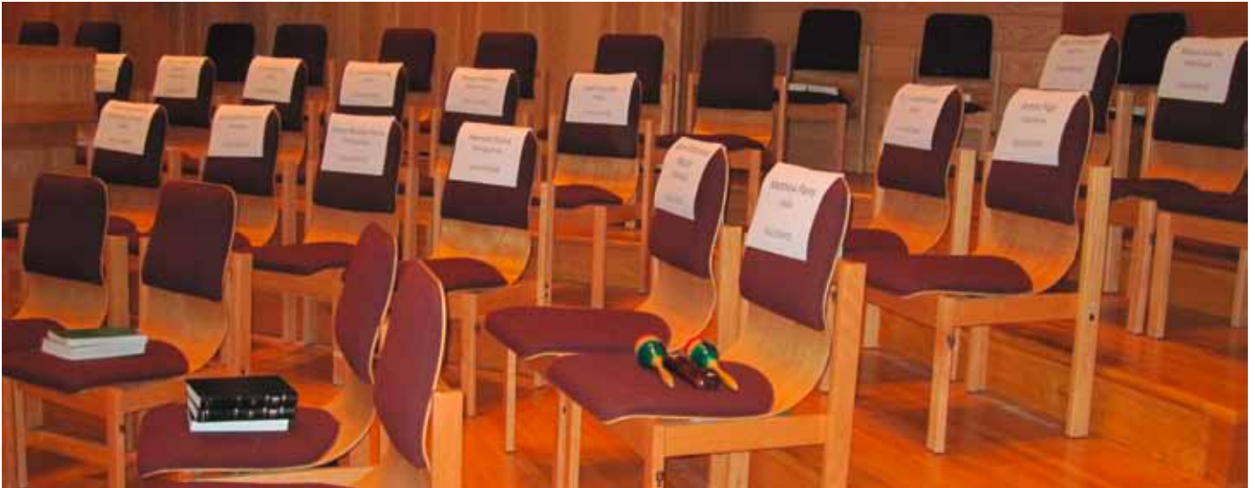
Leere Stühle für jene Teilnehmenden, die keine Einreisegenehmigung in die USA erhielten.