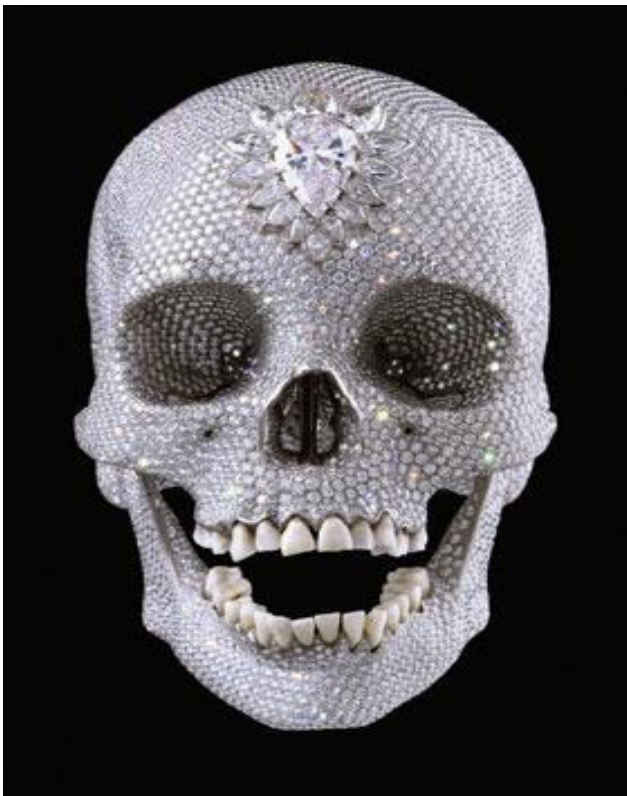
Damien Hirst, For the love of God, 2007, platinum, diamond, human teeth