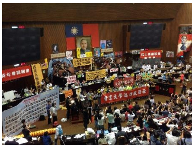
Das besetzte Parlament 2014

China formulierte in den 80er Jahren die Politik „ein Land, zwei Systeme“ für Taiwan, Hong-Kong und Macao als Teilgebiete der Volksrepublik. Taiwan will diese Lösung nicht. Der Druck Chinas steigt und die militärische Bedrohung ist seit Jahren Alltag für Taiwan.