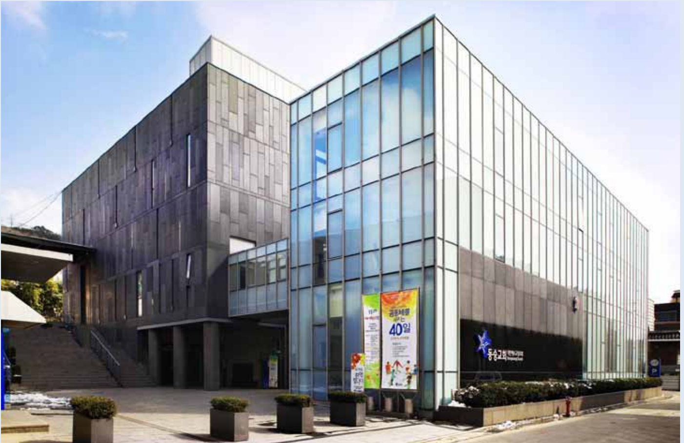
Dongsung-Kirche, Presbyterian Church of Korea, Seoul, Südkorea