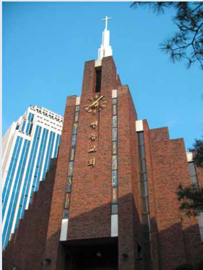
Yeondong-Kirche, Presbyterian Church of Korea, Seoul, Südkorea

Die koreanischen Kirchen betrachteten die Reformation stets als eine Bewegung, die das Wort Gottes ins Zentrum stellte. Nach dem Vorbild Calvins ist das Wort Gottes Wesen und Massstab der Kirche zugleich. Calvin war überzeugt, dass Gottes Wort in der Bibel direkt an die Menschen gerichtet und mit «Gottes absoluter Souveränität» gleichzusetzen ist. Durch letztere ist das Heil für uns Sünder und Sünderinnen präsent und darin steckt gleichzeitig auch das wesentliche Prinzip des