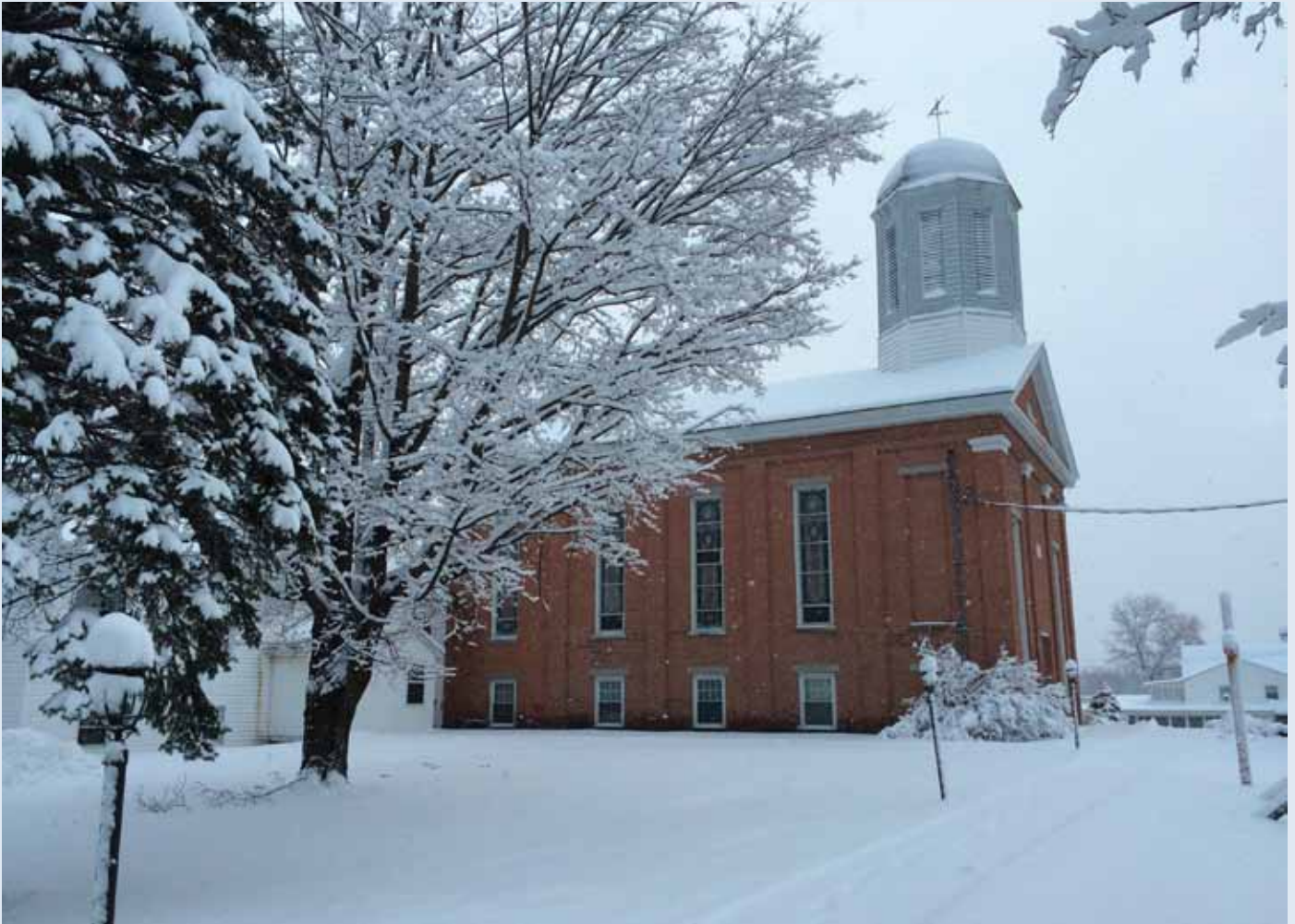
Lisa's Kill Reformed Church in Colonie, Bundesstaat New York, USA

dikal alle einbeziehenden Liebe Christi, die weniger auf einer strikten Befolgung von Regeln als vielmehr auf der Gnade beruht. Diese Kluft zwischen strikter Befolgung und radikalem Einbezug ist wahrscheinlich die grösste Herausforderung, die die US-amerikanischen Kirchen heute zu bewältigen haben. Wegen solcher Fragen kommt es zu Kirchenspaltungen, und zudem sind – vor allem unter jungen Menschen – nachlassende Beteiligung und sinkende Mitgliederzahlen festzustellen. Dort, wo man die Kirche als richtend, heuchlerisch und intolerant wahrnimmt, wird kirchliches Zeugnis ganz erheblich erschwert.