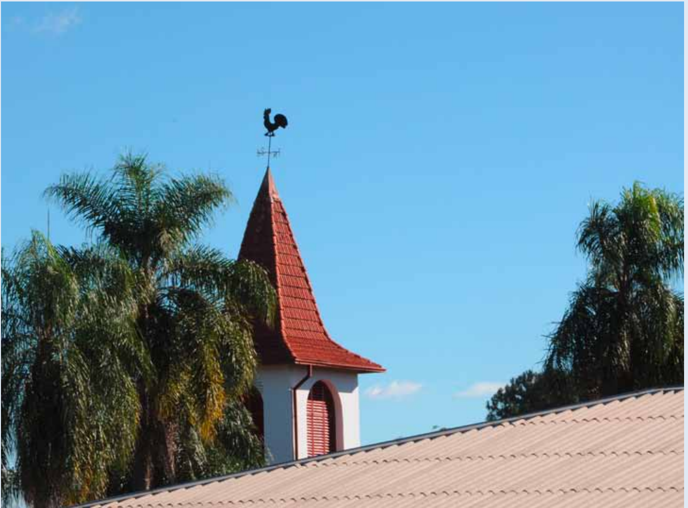
Iglesia Evangélica Suiza, Ruiz de Montoya, Argentinien

sich die Minderheitskirchen, die aus der Reformation stammen. Für manche ihrer Mitglieder, insbesondere in der Stadt, hat jedoch der christliche Glaube die gestaltende Kraft verloren. Die daraus folgende Abnahme der Mitglieder wirkt sich auch auf die Finanzen der Kirchen aus. Missionarische Bestrebungen, sowohl die ethnisch-konfessionell geprägte Mitgliedschaft zu erhalten als auch neue Mitglieder hinzuzugewinnen, haben bisher noch keine nennenswerten Früchte gezeigt. Trotz des Anwachsens der (Neu-) Pfingstler und der Säkularisierung hält der historische Protestantismus treu am Erbe der Reformation fest. Dazu gehören die Offenheit für den ökumenischen Dialog und das soziale Engagement. Dies drückt sich in institutioneller und politischer Gemeindediakonie, theologischer Ausbildung und Veröffentlichungen aus, die sich gegen gefährliche Entwicklungen in der Gesellschaft wehren. Ist das als reformatorischer Geist anzusehen? Der traditionelle katholische Geist ist überall spürbar; wie stellt man den protestantischen fest?