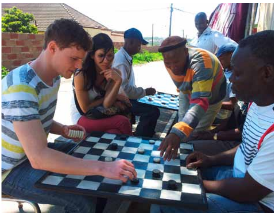
Faire Begegnungen mit Menschen aus anderen Kulturen – unterwegs wie zuhause

Seit über dreissig Jahren hinterfragt der Arbeitskreis tourismus & entwicklung (akte) das weltweite Reisen und den Tourismus aus entwicklungspolitischer Sicht. Die dabei gewonnenen Erkenntnisse sammelt und teilt die Nichtregierungsorganisation (NGO) auf ihrem neugestalteten Webportal www.fairunterwegs.org . Das Ziel: Reisende wie Branche zum verantwortlichen Handeln anzuregen – auf Reisen wie zuhause.