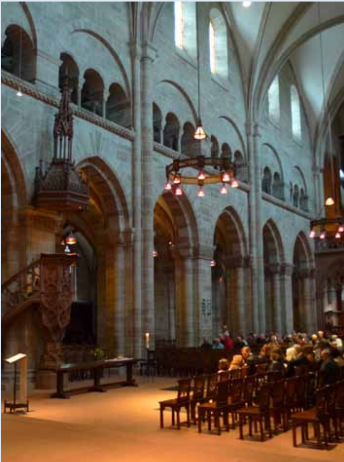
Basler Münster