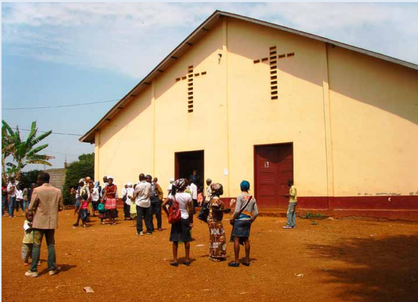
Temple de l'Eglise Evangélique du Cameroun de Ndiangdam à Bafoussam, Cameroun