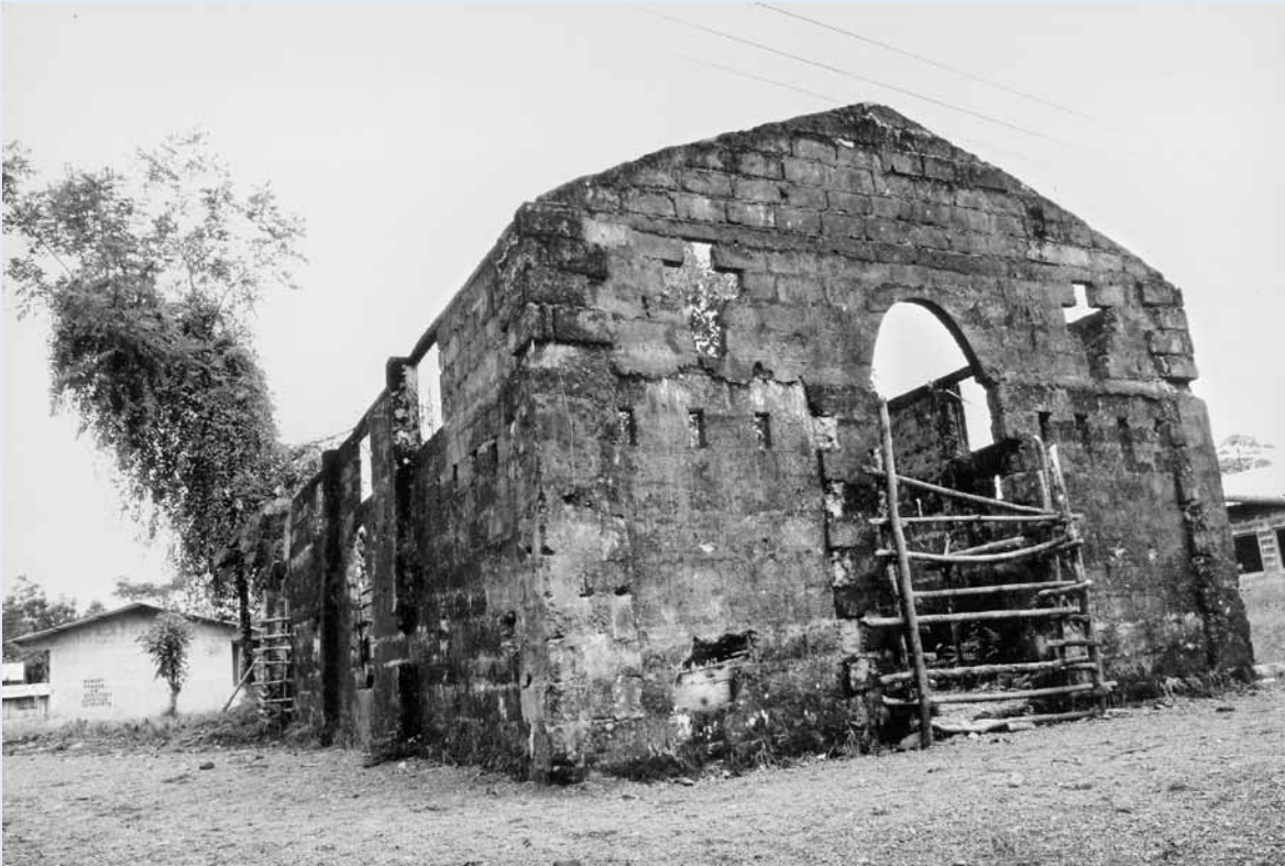
«Ich will nicht mit ansehen, wie so viele Familien zur Aufgabe ihres Zubauses gezwungen und vertrieben werden und ihre Wurzeln und Traditionen zurücklassen.» (Foto und Aussage: Roquelma Palacios Valóyes, siehe Seite 11)