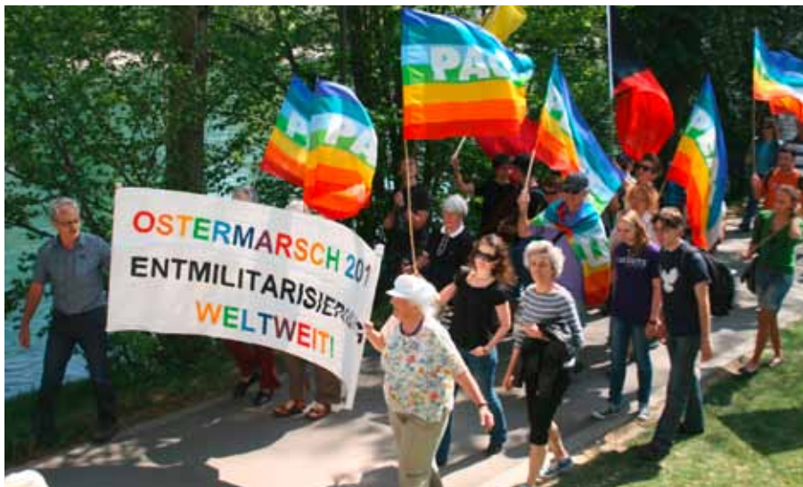
Ostermarsch 2011: Rund 800 Menschen marschierten am Ostermontag vom Eichholz der Aare entlang zum Münsterplatz

Die Bewegung um den Versöhnungsbund entstand aus dem spontanen Versprechen eines deutschen Pfarrers und eines britischen Quäkers auf dem Bahnsteig in Köln am Vorabend des ersten Weltkrieges. Beide hatten in Konstanz an einer internationalen kirchlichen Friedenskonferenz teilgenommen, welche versuchte den Krieg abzuwenden. Die Selbstverpflichtung der beiden zog Kreise in England, Deutschland und in den USA, und 1919 erhielt die Bewegung konkrete Form im International Fellowship of Reconciliation (IFOR) . IFOR hat einen offiziellen NGO-Status bei der UNO, was bedeutet, dass sich seine Mitglieder an diversen Stellen und Veranstaltungen der UNO einbringen können.