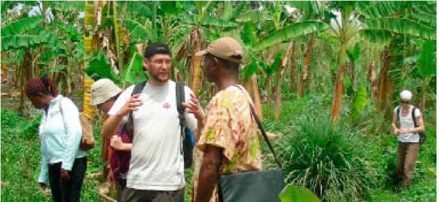
Visite des plantations et discussion avec les paysans