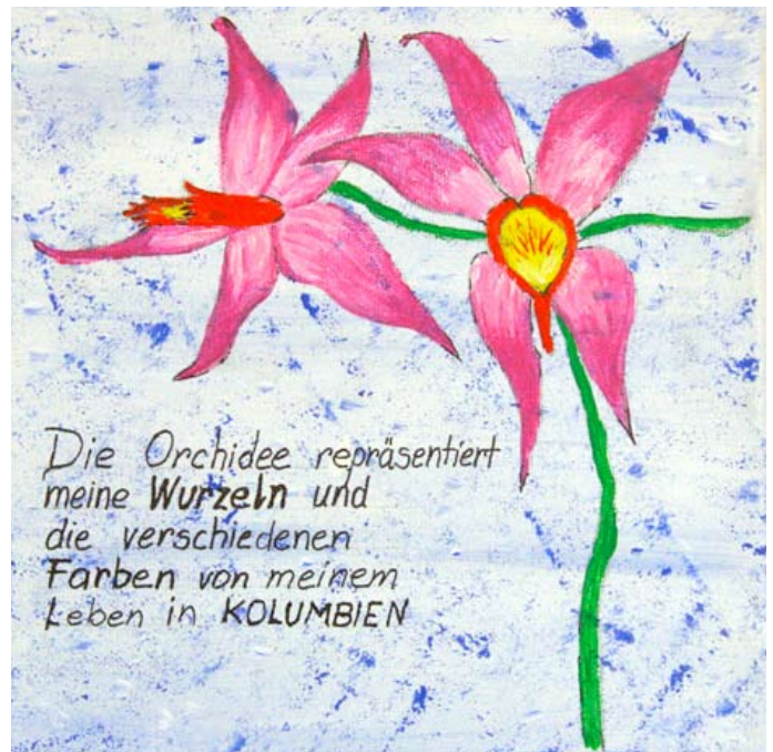
Zeichnung: Cataldo Olga

Unsere Homepage ist neu gestaltet worden. Sie finden hier unsere Arbeitsthemen und Publikationen (auch zum Herunterladen).