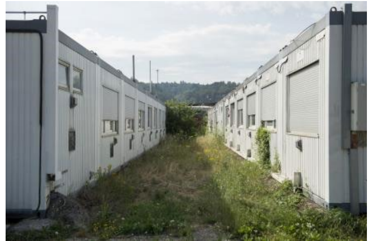
Rückkehrzentrum Biel-Bözingen bis zu 200 Personen